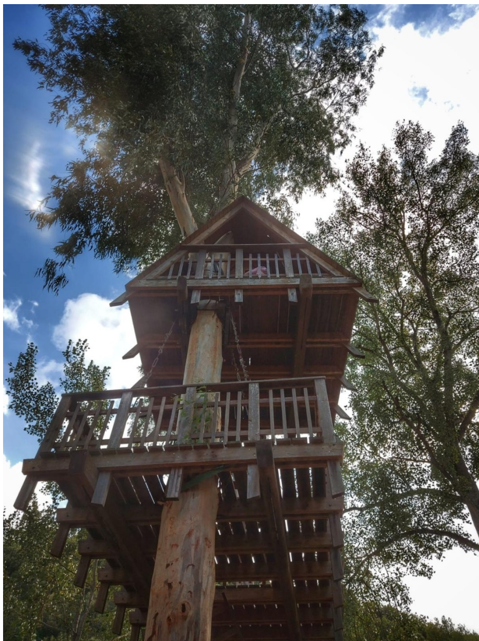
Vista della casa sull'albero nel Parco di Allai