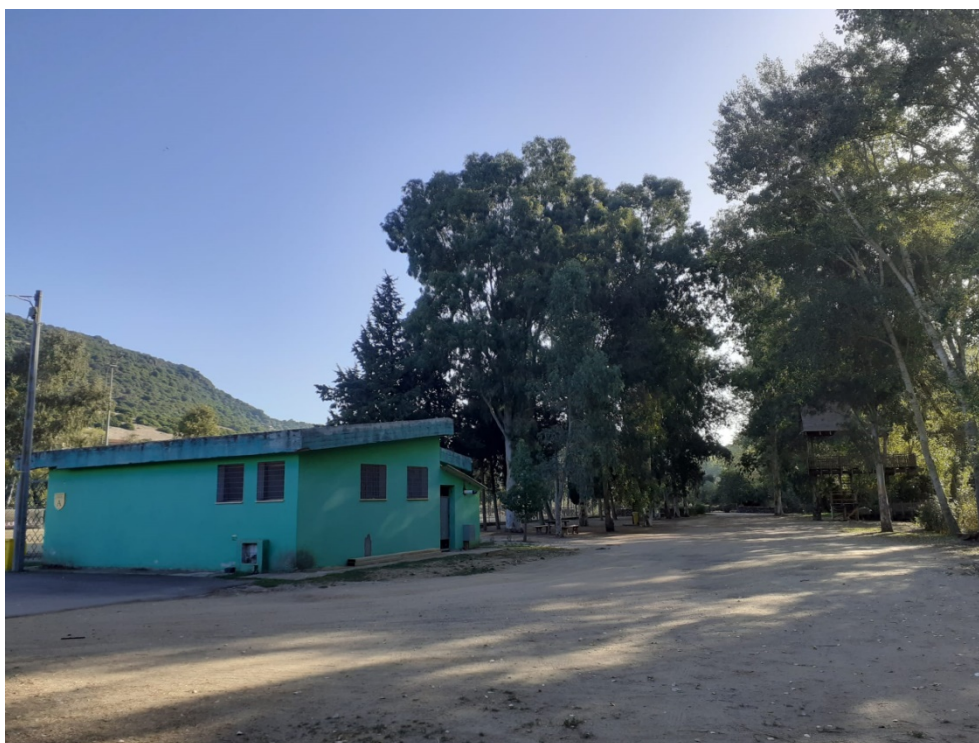
Corpo di fabbrica in oggetto con scorcio della casa sull'albero