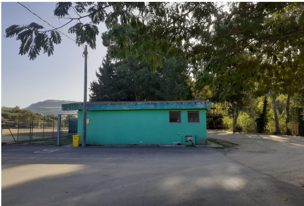
Corpo di fabbrica in oggetto con scorcio della casa sull'albero